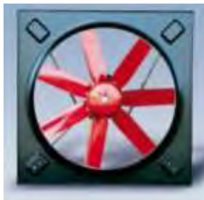
Konstruktivna konfiguracija modela Ø800 - Ø1000

Niskoprofilni zidni aksijalni ventilator sa aluminijumskom elisom. Postoje monofazni HCBB i trofazni modeli HCBT zaštite IP65 (osim za modele 800, 900 i 1000 koji imaju IP55 zaštitu) i izolacije F (radna temperatura od -40°C do 70°C, osim kod modela 800 i 1000 za koje je od -20°C do 40°C) i sa termičkom zaštitom (osim kod modela 800 i 1000).